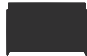
Wrench (Wrench Included)